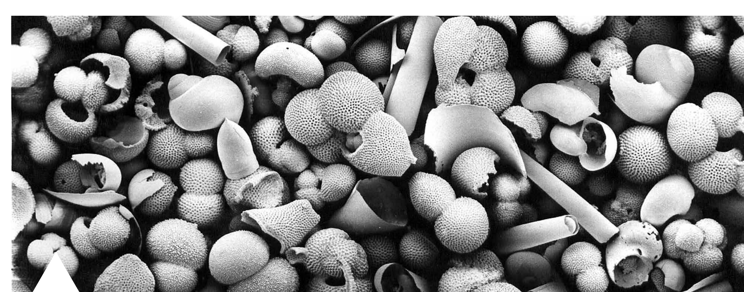
Foraminiferen sind für Paläo-Ozeanographen ein wichtiges biogeochemisches Archiv. Man findet die meist 0,2 bis 0,5 Millimeter großen Einzeller in großer Zahl sowohl im offenen Ozean als auch auf dem Meeresboden. Foto: Planktische Foraminiferen aus dem Golf von Aqaba [Eilat], Ch. Hemleben

Das größte Umweltarchiv überhaupt ist der Meeresboden. Ständig lagern sich abgestorbene Organismen auf dem Grund der Meere ab. Die Überreste der Lebewesen in Kalk-