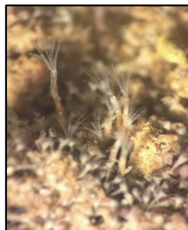
Deutscher Name: Rohrenmoostierchen

Deutscher Name: Moostierchen Nahrung: meistens Phytoplankton Laichzeit: Spätsommer bis Frühherbst Andere: schnell wachsend