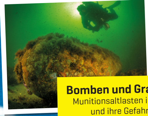
Bomben und Granaten Munitionsaltlasten im Meer und ihre Gefahren