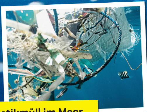
Plastikmüll im Meer Wieviel Mikroplastik ist an unseren Küsten?