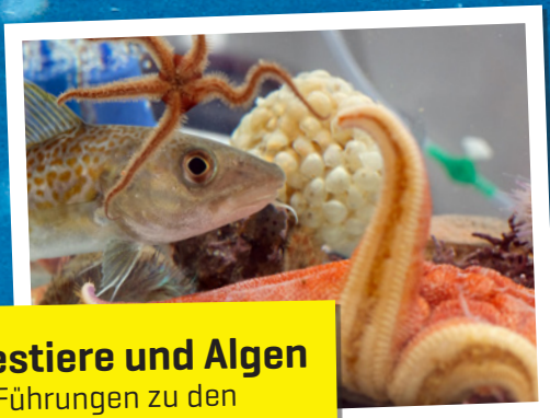
Meerestiere und Algen + Führungen zu den Kieler Benthokosmen

Freitag, 23.06.2023 von 10 bis 17 Uhr am GEOMAR-Anleger an der Kiellinie